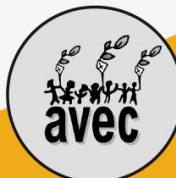
LE COMITÉ AVEC Personnes en situation de pauvreté, intervenanteEs et chercheurEs