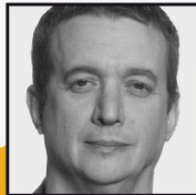
DAN BIGRAS Auteur-compositeur-interprète et acteur

Re-considérer le fric, le doux et le dur