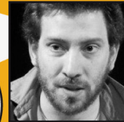
JULIAN BOAL Formateur brésilien spécialisé dans le théâtre de l'opprimé