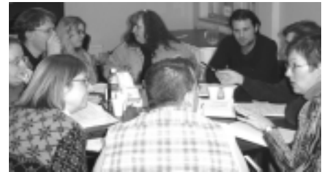
Délégués discutant lors de la réunion d'orientation.

Mais revenons d'abord sur la rencontre d'orientation de la semaine dernière à Châteauguay. Elle s'est avérée un moment important dans notre vie de réseau tant par la présence nombreuse des groupes membres du Collectif (21 groupes nationaux sur 30 et 13 régions sur 16) que par les décisions que nous y avons prises.