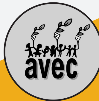
LE COMITÉ AVEC

Personnes en situation de pauvreté, intervenanteEs et chercheurEs